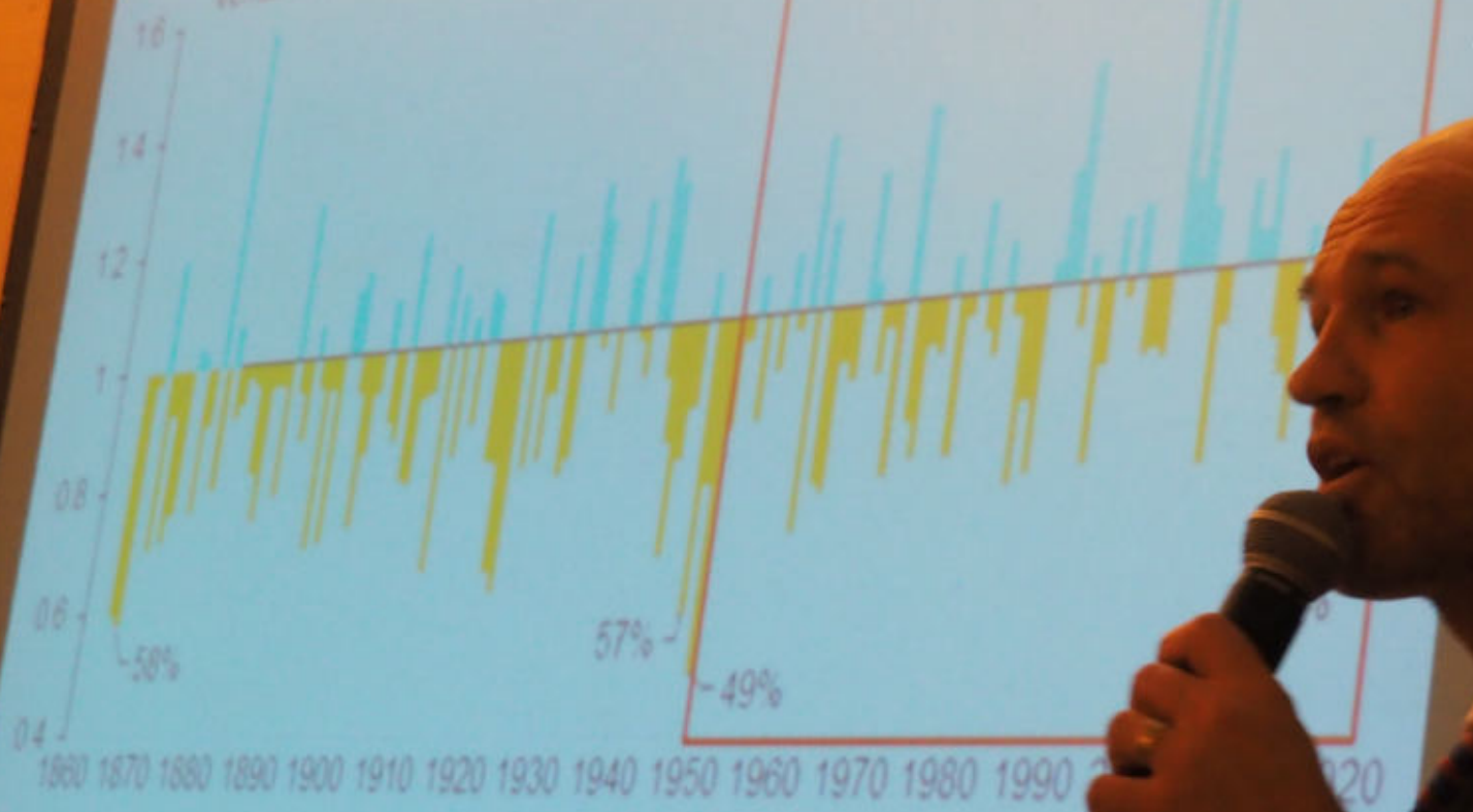
Niederschlag (Februar-Oktober) in Zürich 1864-2018 Verhältnis zum Durchschnitt 1961-2010